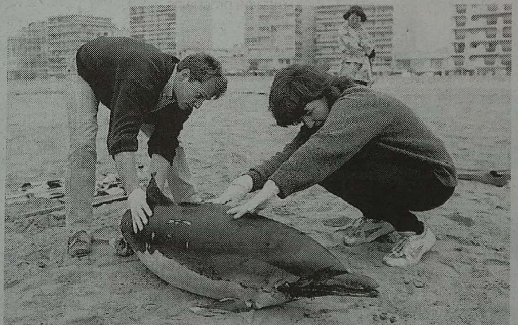
Le dauphin mort porté par des courants d'est vers Canet, serait mort d'une blessure provoquée par une hélice.